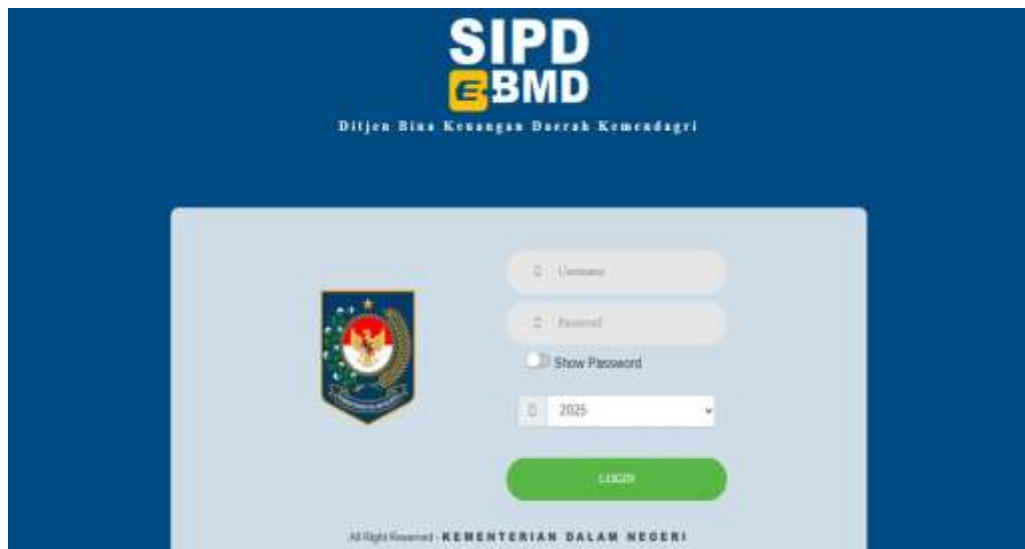
Gambar 3. Website eBMD

Gambar 2. merupakan contoh dokumen Harga Perkiraan Sendiri (HPS). merujuk pada estimasi biaya barang atau jasa yang ditentukan oleh Pejabat Pembuat Komitmen (PPK) yang berfungsi sebagai alat untuk mengevaluasi kepatutan harga penawaran dan/atau kecocokan harga per unit(Ermelia & Soemitra, 2022). Dokumen ini umumnya mencakup rincian mengenai barang yang dibutuhkan, kuantitas, dan tanggal yang diinginkan, serta berfungsi sebagai langkah pertama dalam proses pengadaan sebelum penerbitan surat perintah pembelian atau purchase order .(Nurjannah et al., 2024)