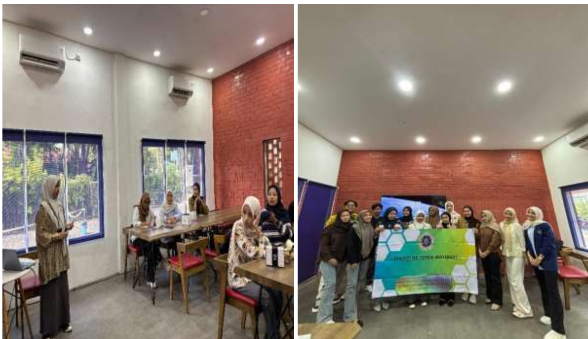
Gambar 2. Dokumentasi Pelaksanaan PKM.

Kegiatan pengabdian kepada masyarakat ini dilaksanakan pada tanggal 10 Juli 2025 yang dimulai pada pukul 10.00 sampai dengan pukul 12.00 WITA bertempat di Wetland Square Banjarmasin, yang diikuti oleh 14 orang peserta. Pelaksanaan kegiatan dilakukan dalam bentuk penyajian materi dan tanya jawab. Kegiatan terlaksana sebagaimana terlihat pada dokumentasi berikut ini: