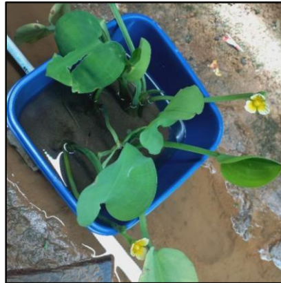
Gambar 2. Proses Aklimatisasi Tanaman Air Genjer Hari ke-5

yang tidak layu, tumbuh subur, dan tidak mati (Kholif et al., 2023b). Proses aklimatisasi tanaman air terhadap air bersih dilakukan selama 2 hari, dihari pertama tanaman air yaitu kangkung air dan genjer terlihat lebih sehat, dari pada saat tanaman air diambil dihari sebelumnya. Proses aklimatisasi tanaman air terhadap air limbah domestik dilakukan selama 8 hari, pada hari ke-3 untuk tanaman air genjer puncak bunga mulai terlihat, sedangkan untuk tanaman kangkung air mulai bertumbuh tunas pada hari ke-5. Pada hari ke-5 bunga pada tanaman genjer mulai mekar.