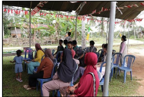
Gambar 4. Kegiatan Sosialisasi Kepada Masyarakat Dusun Airport