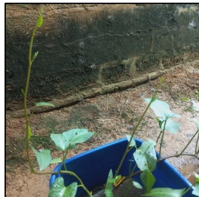
Gambar 3. Proses Aklimatisasi Tanaman Air Kangkung Air Hari ke-5