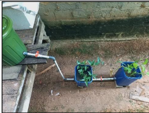
Gambar 6. Rangkaian Unit Wetland dengan Tanaman Kangkung Air dan Genjer

Berdasarkan tanaman air yang digunakan pada wetland ini yaitu tanaman kangkung air dan genjer. Tanaman genjer efisiensi untuk parameter TSS 79,25%, parameter amoniak 79,28%, COD penyisihan sebesar 79,23%, parameter BOD memiliki penyisihan 88,27%, parameter pH sebesar 17,62% (Fajriaty et al., 2025). Efisiensi pada tanaman kangkung air pada parameter BOD yaitu 86% dan COD yaitu 87% (Saragih et al., 2023).