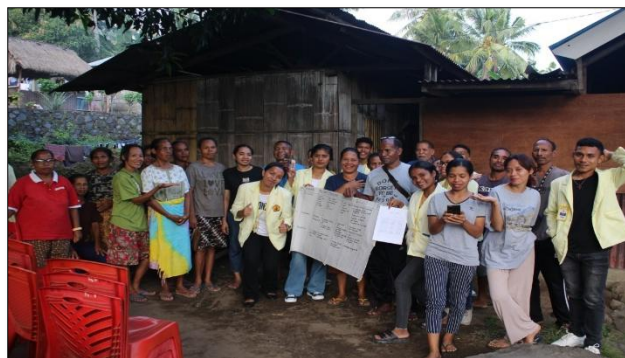
Gambar 3. Kegiatan Diskusi Kampung

Kegiatan ini difasilitasi oleh mahasiswa dan diikuti oleh masyarakat setempat yang berperan sebagai peserta sekaligus narasumber, serta didukung oleh pemerintah desa dan tokoh masyarakat. Pelaksanaan diskusi kampung dilakukan secara kolaboratif. Mahasiswa