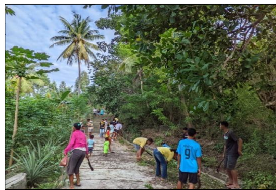
Gambar 5. Kegiatan Bakti Sosial