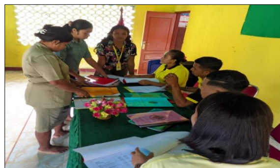
Gambar 2. Kegiatan Pembinaan Administrasi Desa

Salah satu program utama dalam kegiatan KKN adalah pembinaan administrasi desa. Program ini dirancang untuk meningkatkan kualitas tata kelola pemerintahan desa, menciptakan transparansi, dan memperkuat akuntabilitas dalam pengelolaan administrasi dan keuangan. Kegiatan ini dilaksanakan pada tanggal 19–21 Juli 2024, bertempat di Kantor Desa Kelitei. Sebanyak 10 mahasiswa KKN dari STPM Santa Ursula Ende berkolaborasi dengan 10 perangkat desa. Pemerintah desa berperan sebagai penanggung jawab utama dalam kegiatan ini. Rincian kegiatan pembinaan administrasi mencakup pembinaan papan struktur desa, melengkapi buku administrasi desa, pengisian buku pajak, pencatatan pendapatan dan pengeluaran desa, pengarsipan surat keluar dan masuk.