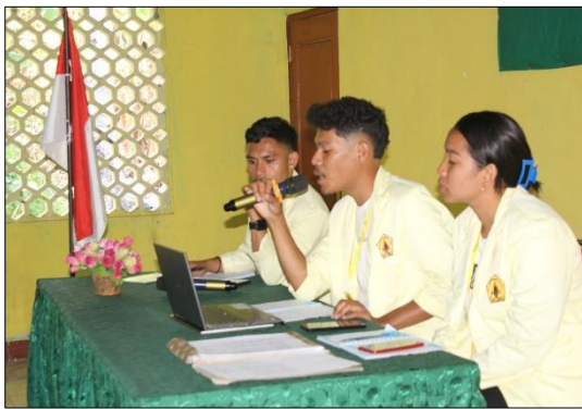
Gambar 4. Kegiatan Penguatan Kapasitas

Kantor Desa Kelitei. Fokus kegiatan adalah memberikan materi kepada perangkat desa, BPD, dan RT mengenai peran dan fungsi kelembagaan desa. Materi disampaikan langsung oleh mahasiswa KKN dari STPM Santa Ursula Ende. Meskipun berjalan lancar, kegiatan ini menghadapi kendala teknis, yakni tidak tersedianya alat bantu presentasi seperti LCD, yang menyebabkan penyampaian materi kurang optimal.